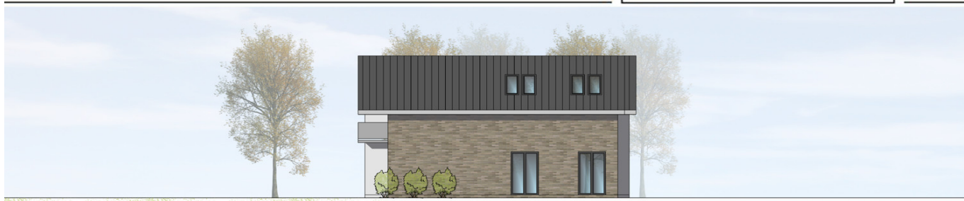
ANSICHT VON SÜDEN | M100