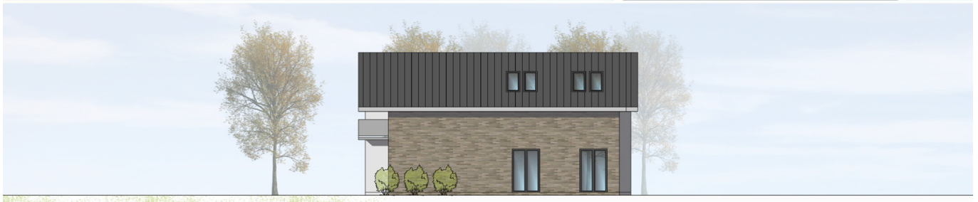
ANSICHT VON SÜDEN | M100