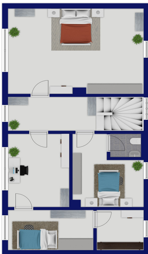
Exposéplan, nicht maßstäblich

Esta planta não é à escala. Os documentos foram-nos entregues pelo cliente. Por conseguinte, não podemos assumir qualquer responsabilidade pela exatidão das indicações.