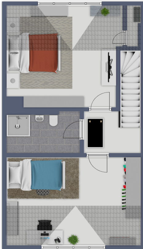
Exposéplan, nicht maßstäblich