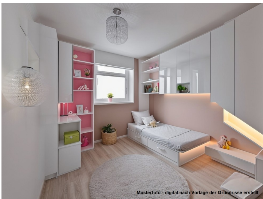
Musterfoto - digital nach Vorlage der Grundrisse erstellt