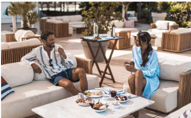
Marina di Scarlino is an ideal destination all year round because it is blessed with an exceptionally mild climate.