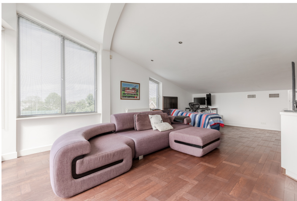
Tolheksbos 10 - Amstelveen Tweede Verdieping