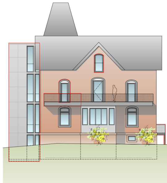
ANSICHT SÜD UMBAU