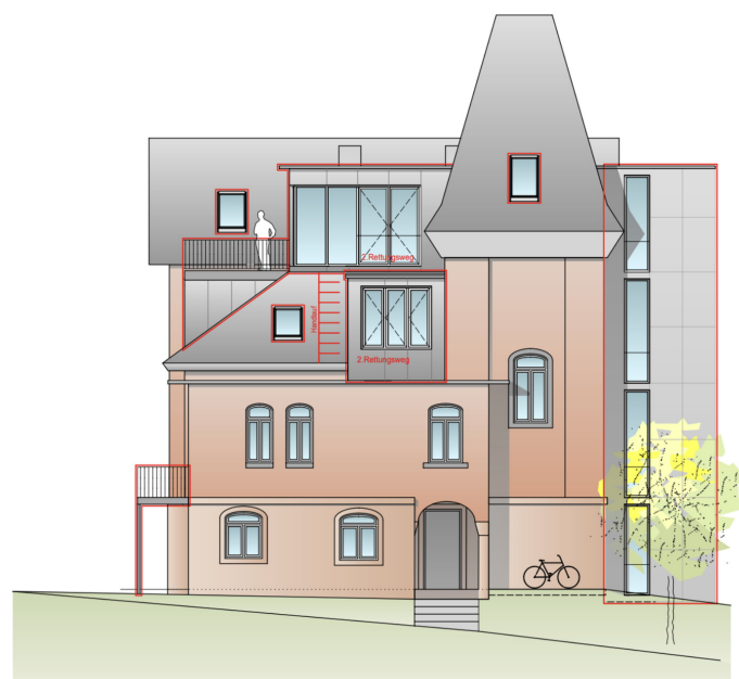
ANSICHT NORD UMBAU