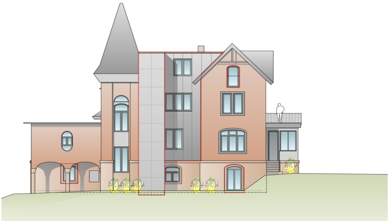
ANSICHT WEST UMBAU

PREÇO DE COMPRA: 925.000 EUR • ÁREA: ca. 459 m 2 • QUARTOS: 16 • ÁREA DO TERRENO: 2.020 m 2