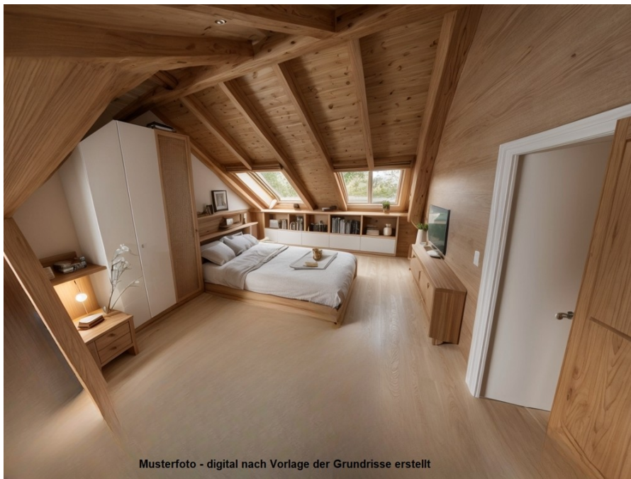
Musterfoto - digital nach Vorlage der Grundrisse erstellt