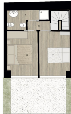
Piano Primo - Villetta 3

LEGENDA 6. camera matrimoniale 7. seconda camera da letto 8. bagno 9. corridoio