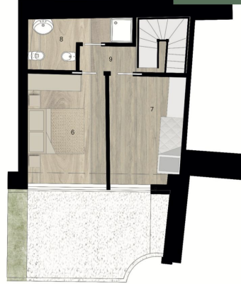
Piano Primo - Villetta 4