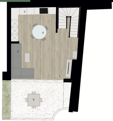
Piano Terra - Villetta 4