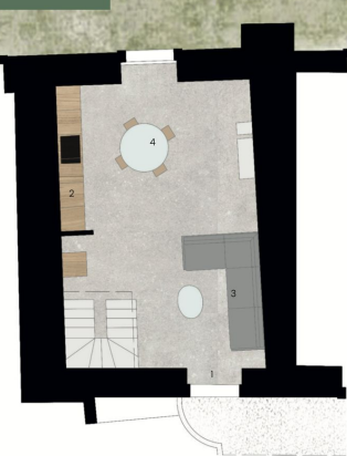
Piano Terra - Villetta 5