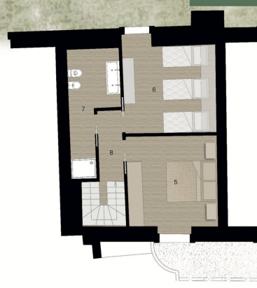
Piano Primo - Villetta 5