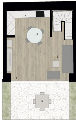
Piano Terra - Villetta 3

LEGENDA 1. ingresso 2. cucina 3. soggiorno 4. area pranzo 5. portico esterno