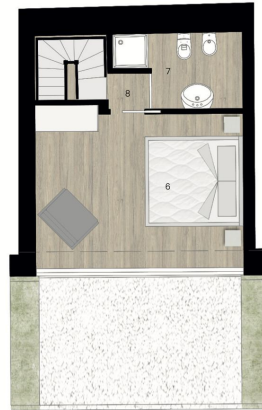
Piano Primo - Villetta 2

LEGENDA 6. camera matrimoniale 7. bagno 8. corridoio