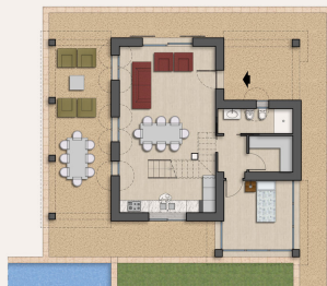
PIANTA PIANO TERRA Scala 1:100