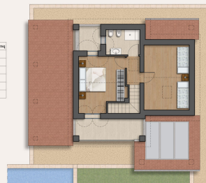
PIANTA PIANO PRIMO Scala 1:100

Questa pianta non è in scala. I documenti ci sono stati dati dal cliente. Per questo motivo, non possiamo garantire la precisione delle informazioni.