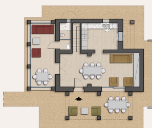
PIANTA PIANO TERRA Scala 1:100