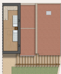
PIANTA PIANO SOTTOTETTO Sca. 1:100

Questa pianta non è in scala. I documenti ci sono stati dati dal cliente. Per questo motivo, non possiamo garantire la precisione delle informazioni.