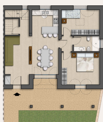
PIANTA PIANO TERRA Sca. 1:100