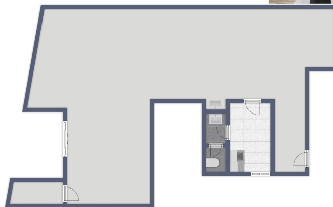
Grundriss nicht maßstabsgetreu

Questa pianta non è in scala. I documenti ci sono stati dati dal cliente. Per questo motivo, non possiamo garantire la precisione delle informazioni.