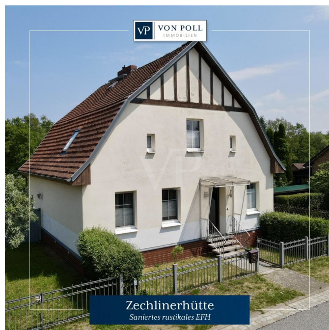
Zechlinerhütte Saniertes rustikales EFH