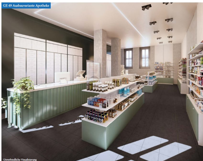
GE 49 Ausbauvariante Apotheke