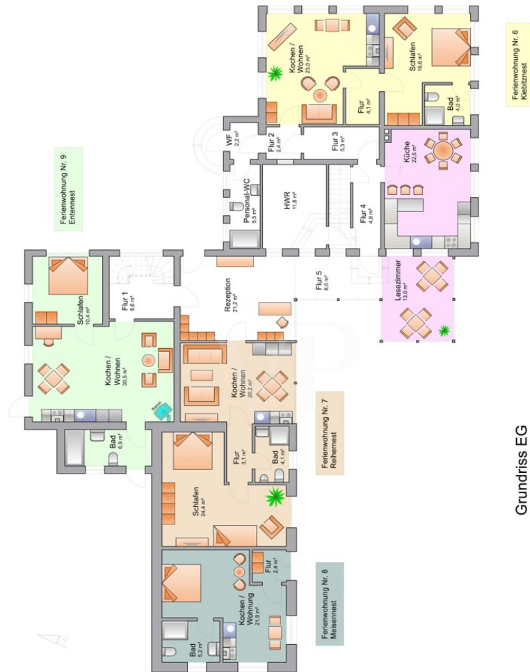
Grundriss EG Hauptgebäude