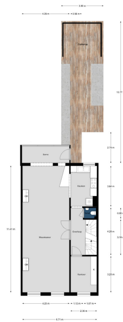
Alphenstraat 60, Den Haag | 1e Verdieping H = 3,13 m