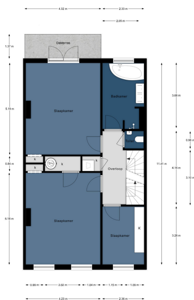
Alphenstraat 60, Den Haag | 2e Verdieping H = 2,36 m