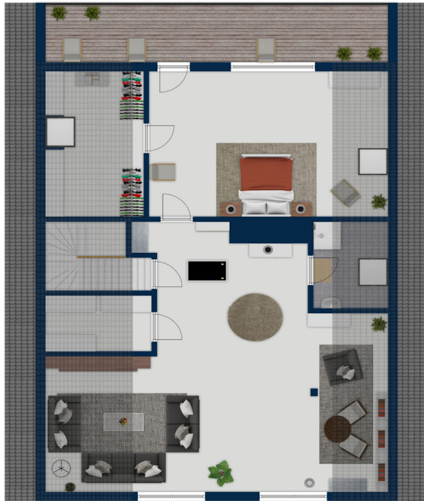
Exposéplan, nicht maßstäblich