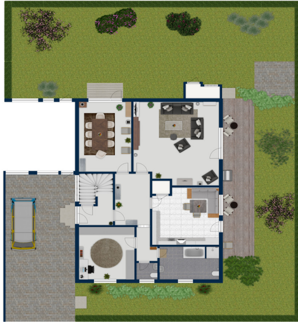
Exposéplan, nicht maßstäblich

Questa pianta non è in scala. I documenti ci sono stati dati dal cliente. Per questo motivo, non possiamo garantire la precisione delle informazioni.