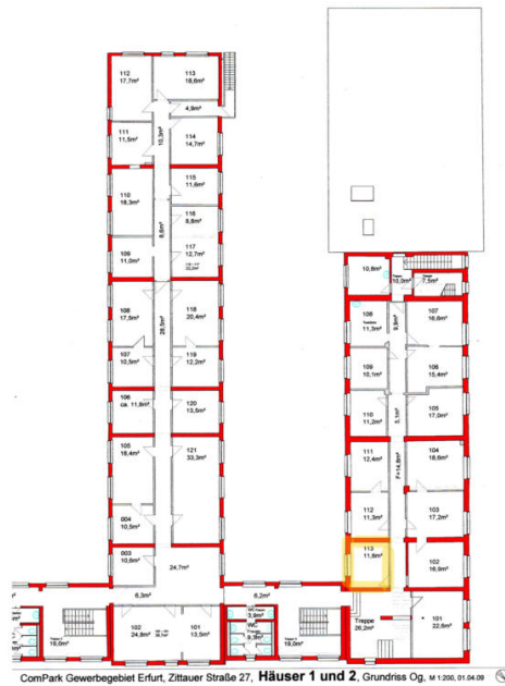
ComPark Gewerbegebiet Erfurt, Zittauer Straße 27, Häuser 1 und 2, Grundriss Og, M 1:200, 01.04.19