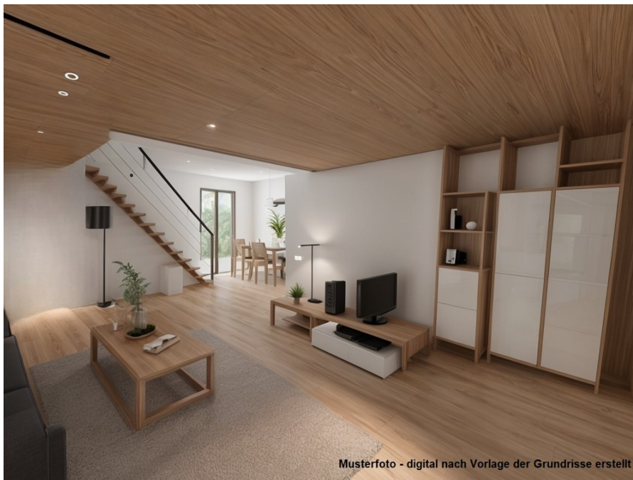
Musterfoto - digital nach Vorlage der Grundrisse erstellt