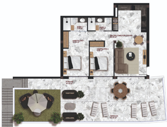
VIVIENDA 1 - PLANTA PISO 1 (1/75)