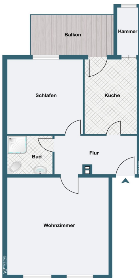
2. Obergeschoss, Wohnung 5

Ez az alaprajz nem méretarányos. A dokumentumokat a megbízó adta át a részünkre. Az adatok helyességéért nem vállalunk felelősséget.