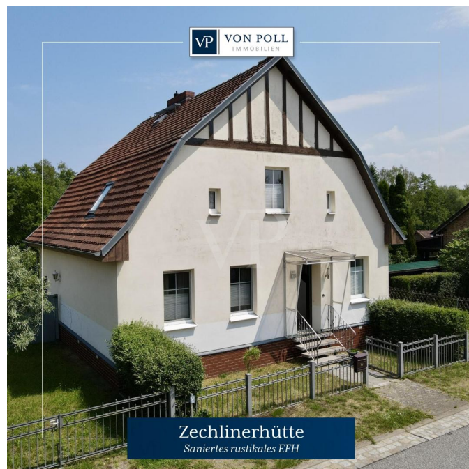
Zechlinerhütte Saniertes rustikales EFH