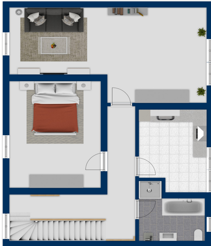
Exposéplan, nicht maßstäblich