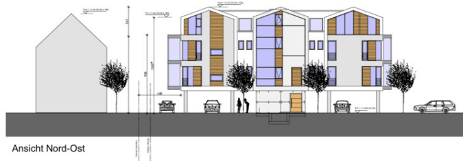
Ansicht Nord-Ost Variante 20°/20°