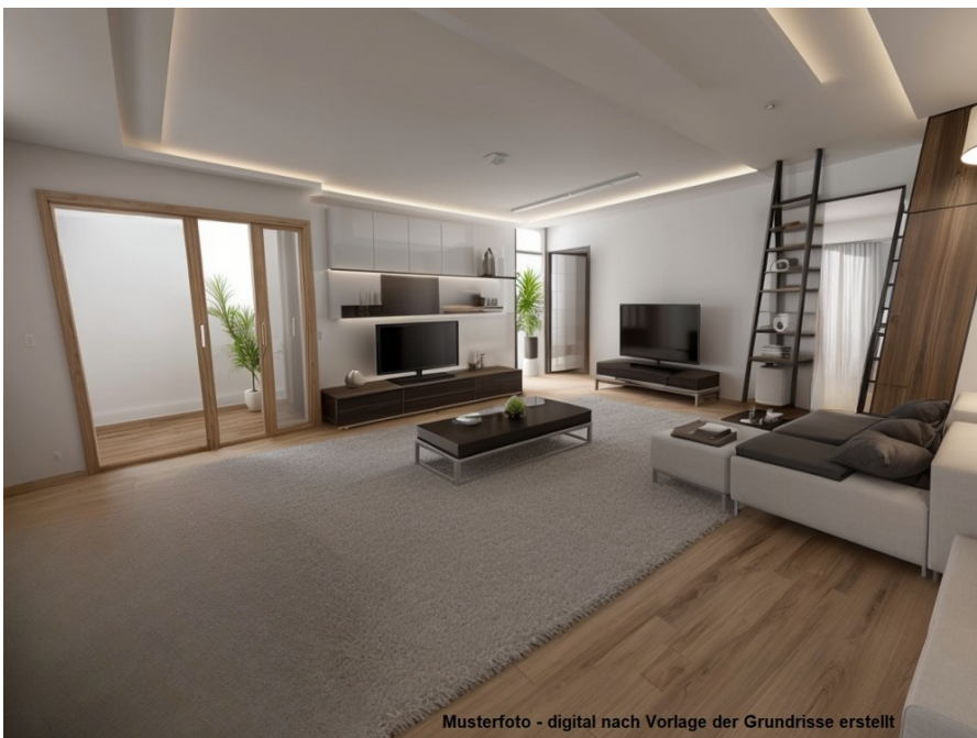
Musterfoto - digital nach Vorlage der Grundrisse erstellt