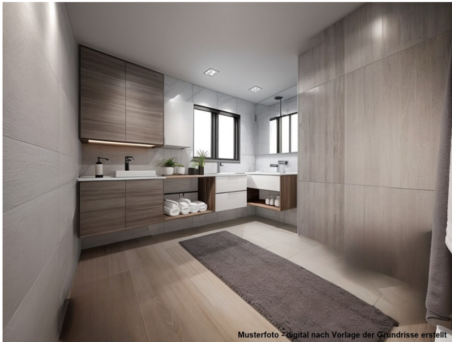
Musterfoto - digital nach Vorlage der Grundrisse erstellt