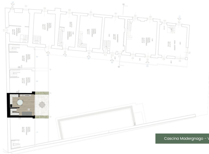
Cascina Madergnago - Villetta 2