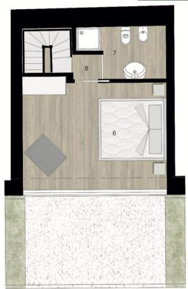
Piano Primo - Villetta 2