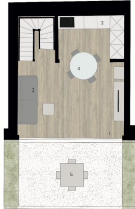
Piano Terra - Villetta 2

LEGENDA 1. ingresso 2. cucina 3. soggiorno 4. area pranzo 5. parking esterno