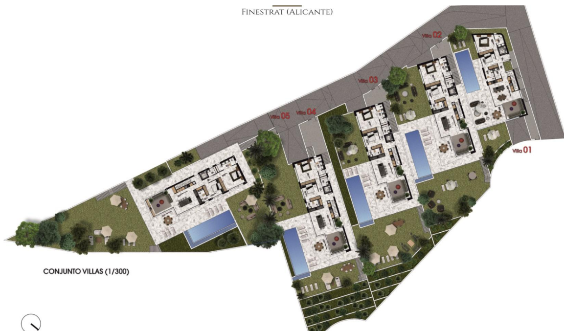
CONJUNTO VILLAS (1/300)