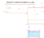
QUADRE DE SUPERFÍCIE CONSTRUÏDES