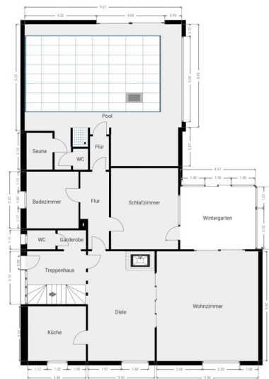
Höpfungbeschränkungen gelten gemäß den Vertragsbestimmungen der De-Ges-DatA. 0 1 2 3 4m 1:94 Page 1/16