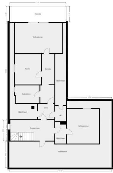
Höpfungbeschränkungen gelten gemäß den Vertragsbestimmungen der De-Ges-DatA. 0 1 2 3 4m 1:94 Page 9/16