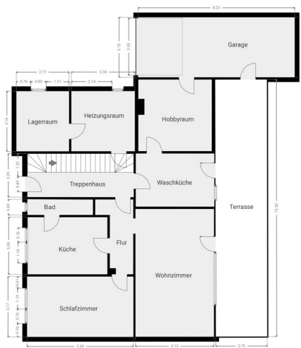
Heftungsbeschränkungen gelten gemäß den Vertriebsbedingungen der De-Ges GmbH. 0 1 2 3 4m 1:84 Page 1/20