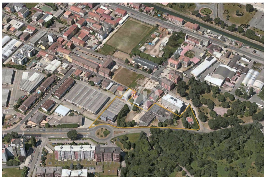
FOTO AEREA CON PERIMTRAZIONE AREA D' INTERVENTO