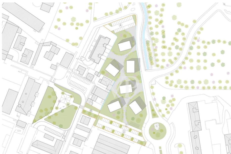
PROGETTO PLANIVOLUMETRICO CON VOLUMI A DESTINAZIONE RESIDENZIALE