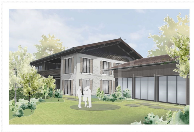
Perspektive - Fassadenstudie_V2