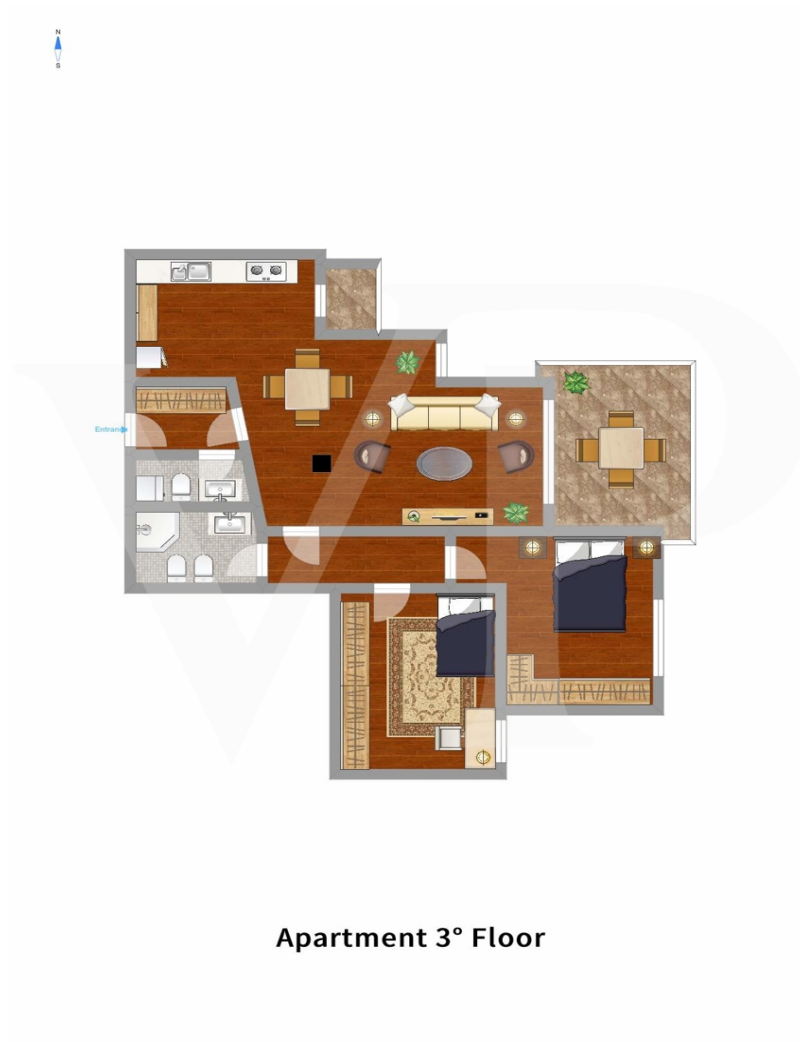
Apartment 3° Floor

???? ? ?????? ??? ?????? ?? ??????????. ?? ????????? ??? ????????? ??? ??? ??????????. ??? ?? ???? ?????, ??? ?????????? ?? ????????????? ??? ?????????? ??? ??????????????.