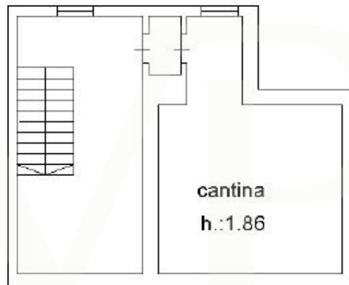
PIANO 1 SOTOSTRADA

???? ? ?????? ??? ?????? ?? ????????. ?? ??????? ???? ??????? ???? ???? ??????. ??? ?? ???? ?????, ??? ?????????? ?? ??????????? ???? ?????????? ??? ??????????????