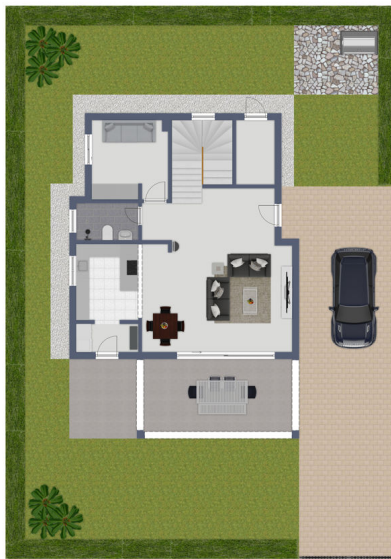
Exposplan, nicht maßstäblich