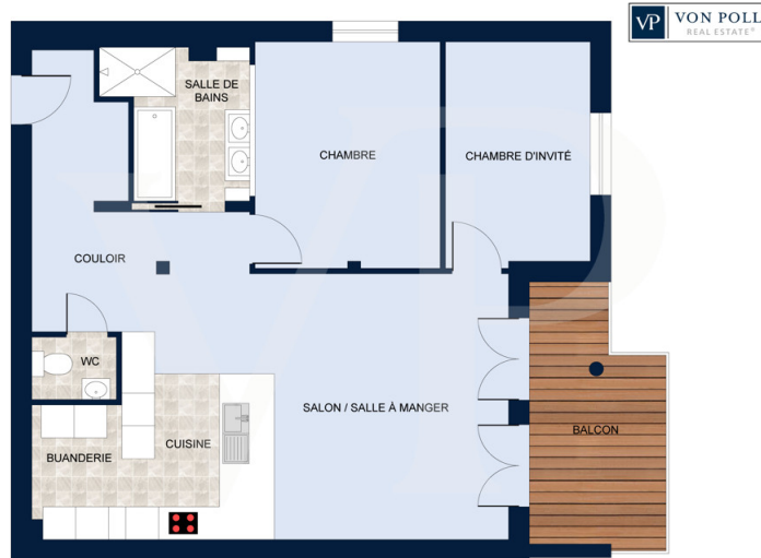
Les plans sont fournis à titre d'information et ne sont pas contractuels

???? ? ?????? ??? ?????? ?? ????????. ?? ??????? ??? ??????? ??? ??? ??????. ??? ?? ????? ?????, ??? ?????????? ?? ????????????? ??? ?????????? ??? ??????????????