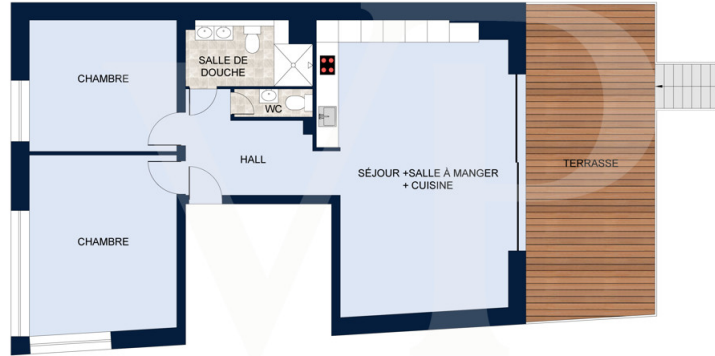
Les plans sont fournis à titre d'information et ne sont pas contractuels