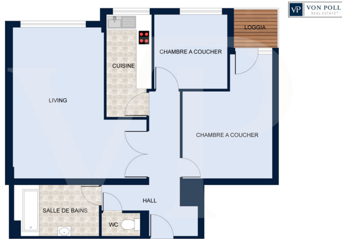
Les plans sont fournis à titre d'information et ne sont pas contractuels

???? ? ?????? ??? ?????? ?? ???????. ?? ?????? ??? ?????? ??? ??? ??????. ??? ?? ?????????, ??? ?????????? ?? ?????????? ??? ?????????? ??? ?????????????.