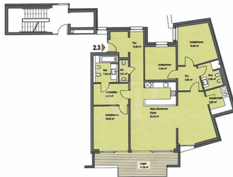
WE 2.3 Wohnfläche: 114,28 m² Nutzfläche: 121,51 m²

???? ? ?????? ??? ?????? ?? ????????. ?? ??????? ??? ??????? ??? ??? ??????. ??? ?? ???? ?????, ??? ?????????? ?? ??????????? ??? ?????????? ??? ?????????????.