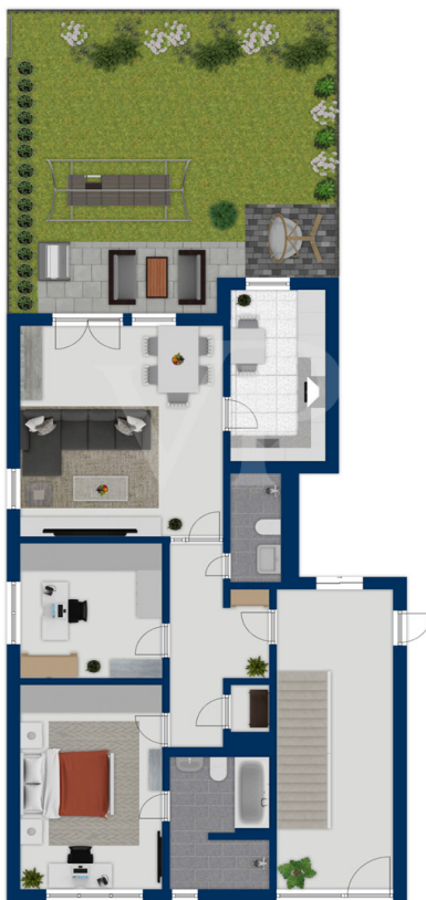
Exposéplan, nicht maßstäblich

???? ? ?????? ??? ?????? ?? ??????????. ?? ????????? ??? ????????? ??? ??? ??????????. ??? ?? ???? ?????, ??? ?????????? ?? ????????????? ??? ?????????? ??? ???????????????.