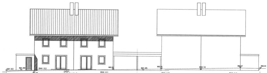
Süd - Ansicht