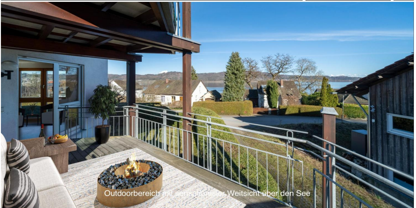
Outdoorbereich mit sensationeller Weitsicht über den See