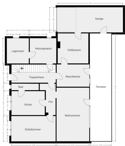
Heftungsbeschränkungen gelten gemäß den Vertriebsbedingungen der De-Ges GmbH. 0 1 2 3 4m 1,84 Page 1/20