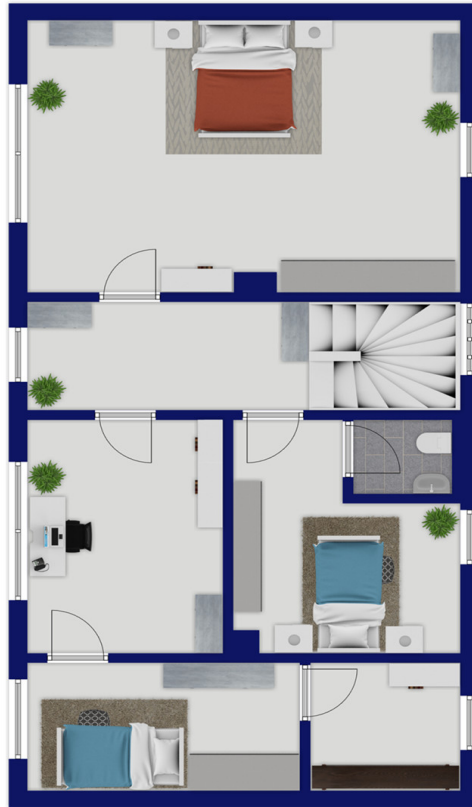
Exposéplan, nicht maßstäblich

Ce plan n'est pas à l'échelle. Les documents nous ont été remis par le client. Pour cette raison, nous ne pouvons pas garantir l'exactitude des informations.