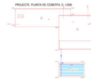
QUADRE DE SUPERFÍCIE CONSTRUÏDES