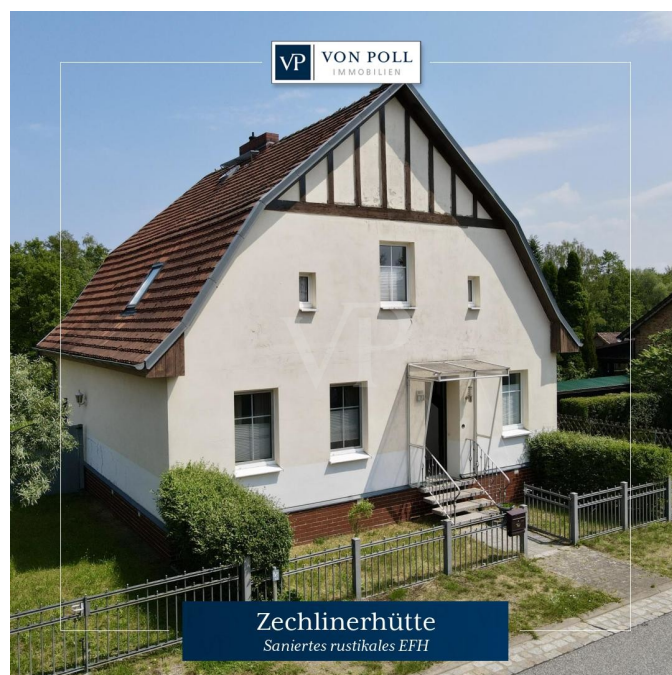
Zechlinerhütte Saniertes rustikales EFH