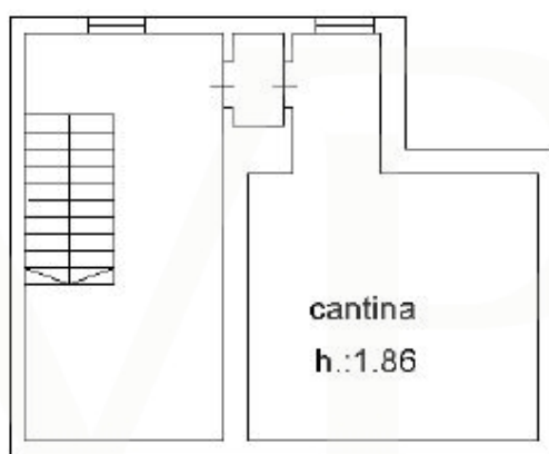
PIANO 1 SOTOSTRADA

Ce plan n'est pas à l'échelle. Les documents nous ont été remis par le client. Pour cette raison, nous ne pouvons pas garantir l'exactitude des informations.